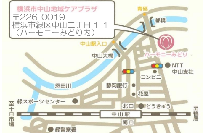
≪ ハーモニーみどり1階 中山駅より徒歩 約7分 ≫