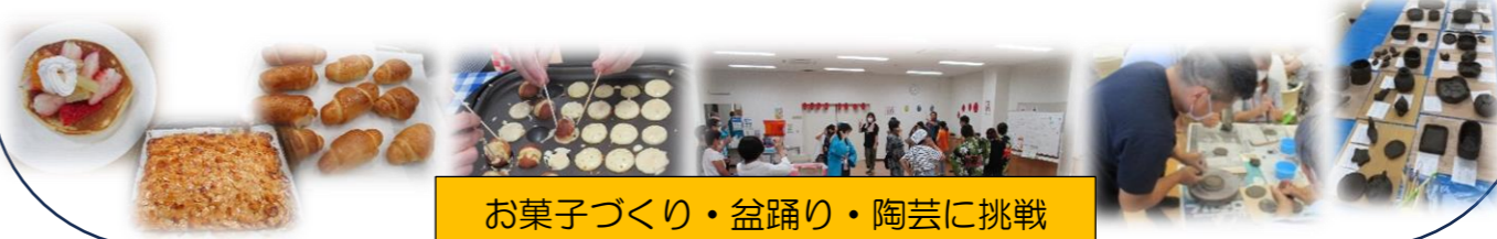
お菓子づくり・盆踊り・陶芸に挑戦

認知症になったら終わりではなく、今やりたいことを今出来ることを、一緒に考える仲間たちと関係者が今後も楽しく活動していく場所でありたいと思います。