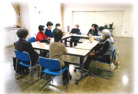
4月のほっしいー (制作:木彫趣味の会)