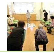
ポッチャコーナー