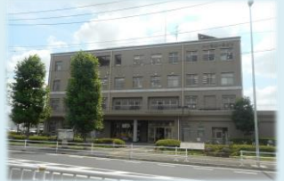
上：ハーモニーみどり外観

中山地域ケアプラザの担当エリアは、新治中部地区と三保地区になります。中山駅からは平坦な道で徒歩6分でこられるため、エリア外の方も立ち寄り、ご相談を受ける時もあります。最も多いのは、介護保険制度の申請手続きのご相談ですが、それ以外にも認知症予防、フレイル予防、生活困窮予防などのご相談もあります。また予防のための講座を各所で開いており、ご依頼があればうかがうこともできます。