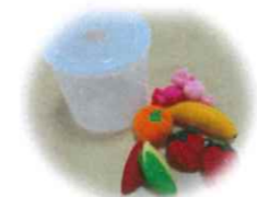
フルーツボックス

【貸出期間】 1週間(貸出無料) 【貸出数】 個人：1つ、グループ：2つまで 【受付】 星川地域ケアプラザ 1階受付