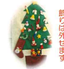
飾りは外せます クリスマスツリー