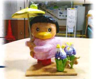
6月のほっしー (制作:木彫趣味の会)