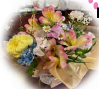
2月開催時の作品です